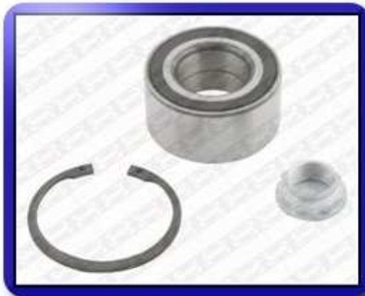
R150.27 – 1994 bis 1995 (Ref. Lager OE BMW 33 41 0090505)

Das Produktprogramm Radlager von SNR Aftermarket beinhaltet zwei Sätze mit Radlagern der 1. Generation mit passivem Encoder: R150.27 u. R150.33. Beiden Radlagersätzen haben wir eine technische Abbildung beigefügt, um Montagefehler in der Werkstatt zu vermeiden.