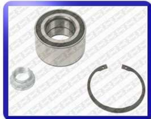
R150.33 – Ab Baujahr 2000 (Ref. Lager OE BMW 31 22 6751978)