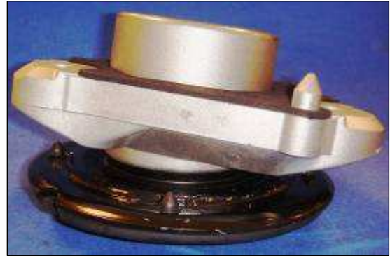
Zustand nach Montage