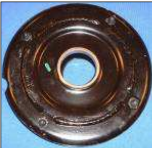
Federteller ohne Federbeinlager

1) Beachten Sie die Montagerichtung des Federbeinlagers (Kugellagers) auf dem Federteller: