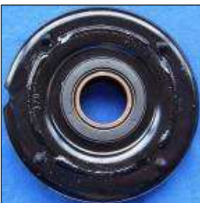
Federteller mit Federbeinlager

Schwarze Seite des Federbeinlagers nach „oben“ in Richtung Domlager