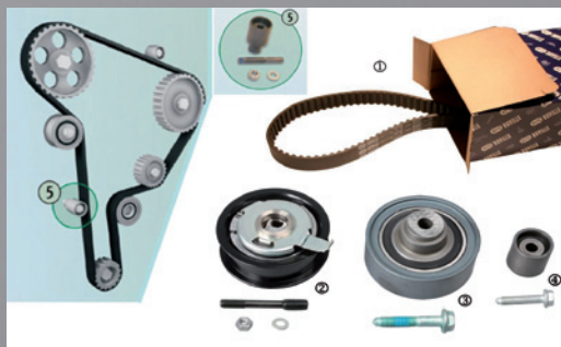
Bild 1: Triebsschema 1.9 TDI/SDI und Packungsinhalt Kit 5549173/5549170, größere Ansicht siehe Seite 2

Angaben des Fahrzeugherstellers sind zu beachten!