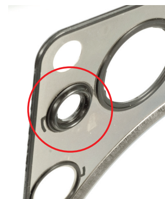
61-37770-00_3 mm höhere Gummi-Dichtlippe