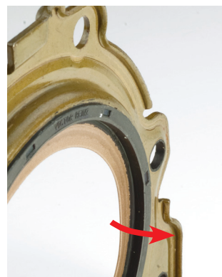
Abbildung 1 _Dichtlippe zeigt zum Getriebe

Mit freundlichen Grüßen Ihr VICTOR REINZ Team