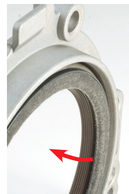
Abbildung 2 _Dichtlippe zeigt zum Motorinneren