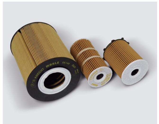
Abbildung 3: Verschiedene Filter – selbe Technologie. Vlies-Endscheiben in unterschiedlichen Ausführungen