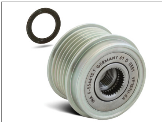
Bild 2: Beim Einbau des Generatorfreilaufes an einem Bosch Generator muß die beiliegende Distanzscheibe mit der Dicke 1,4 mm verwendet werden!

Durch starke dynamische Bewegungen des Keilrippenriemens kann es bei Fahrzeugen mit starrer Generatorriemenscheibe zu starker Geräuschbildung kommen.