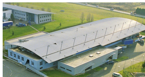
ElringKlinger Meillor SAS, Standort Chamborêt. Fertigungsprogramm: Zylinderkopfdichtungen und Spezialdichtungen.

Insbesondere in Frankreich mit ElringKlinger Meillor SAS und in Italien mit ElringKlinger Oigra-Meillor s.r.l. konnte die Marktstellung sowohl im Erstausrüstungs- als auch im Ersatzteilbereich deutlich gestärkt werden. ElringKlinger Oigra-Meillor in Settimo-Torinese ist seit Juli 2011 für den Vertrieb von Elring-Produkten in Italien zuständig.