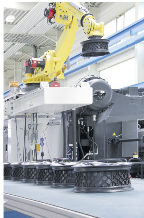
Konzeptstudie einer Pkw-Felge aus Kunststoff, gefertigt bei Hummel-Formen GmbH