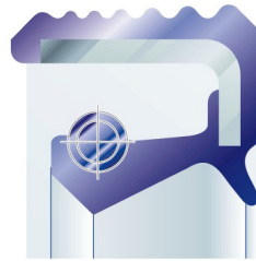
Standard Radialwellendichtring (Bauart ASW)

Für die Reparatur steht der PTFE-Radialwellendichtring als einzelnes Ersatzteil sowie als Bauteil mit fest integriertem Dichtring zur Verfügung. In diesem Fall muss das komplette Gehäuse mit ausgetauscht werden.