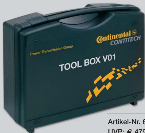
Artikel-Nr. 6503700000 UVP: € 479,- + Mwst

Bei Fragen rufen Sie uns an: Techn. Hotline +49 511 938-5178