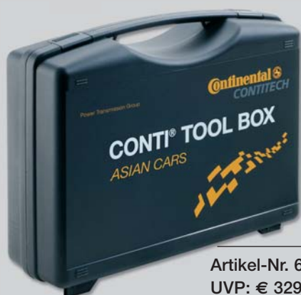
Artikel-Nr. 65 76 476 000 UVP: € 329,- + Mwst

Bei Fragen rufen Sie uns an: Techn. Hotline +49 511 938-5178